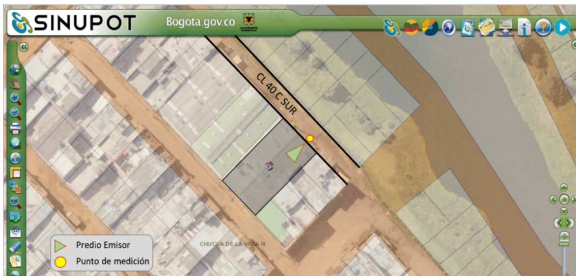
Figura 1. Ubicación del Predio Emisor y Punto de Medición

Nota 4: datos suministrados en el Anexo No 5. Reporte SINUPOT.